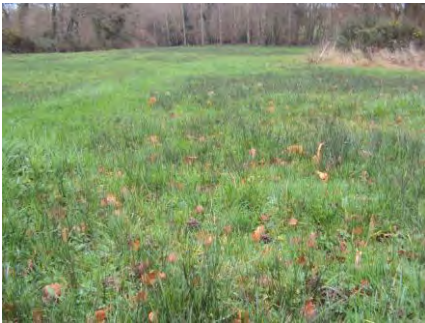
Prairie humide de la vallée du Clos

Située sur le bassin versant de la baie de la Fresnaye, la commune de Matignon a engagé, dès le début 2013, l'inventaire de ses zones humides et cours d'eau ; l'objectif étant de préserver ou restaurer ces milieux aquatiques particuliers pour favoriser la reconquête de la qualité de l'eau en baie de la Fresnaye.